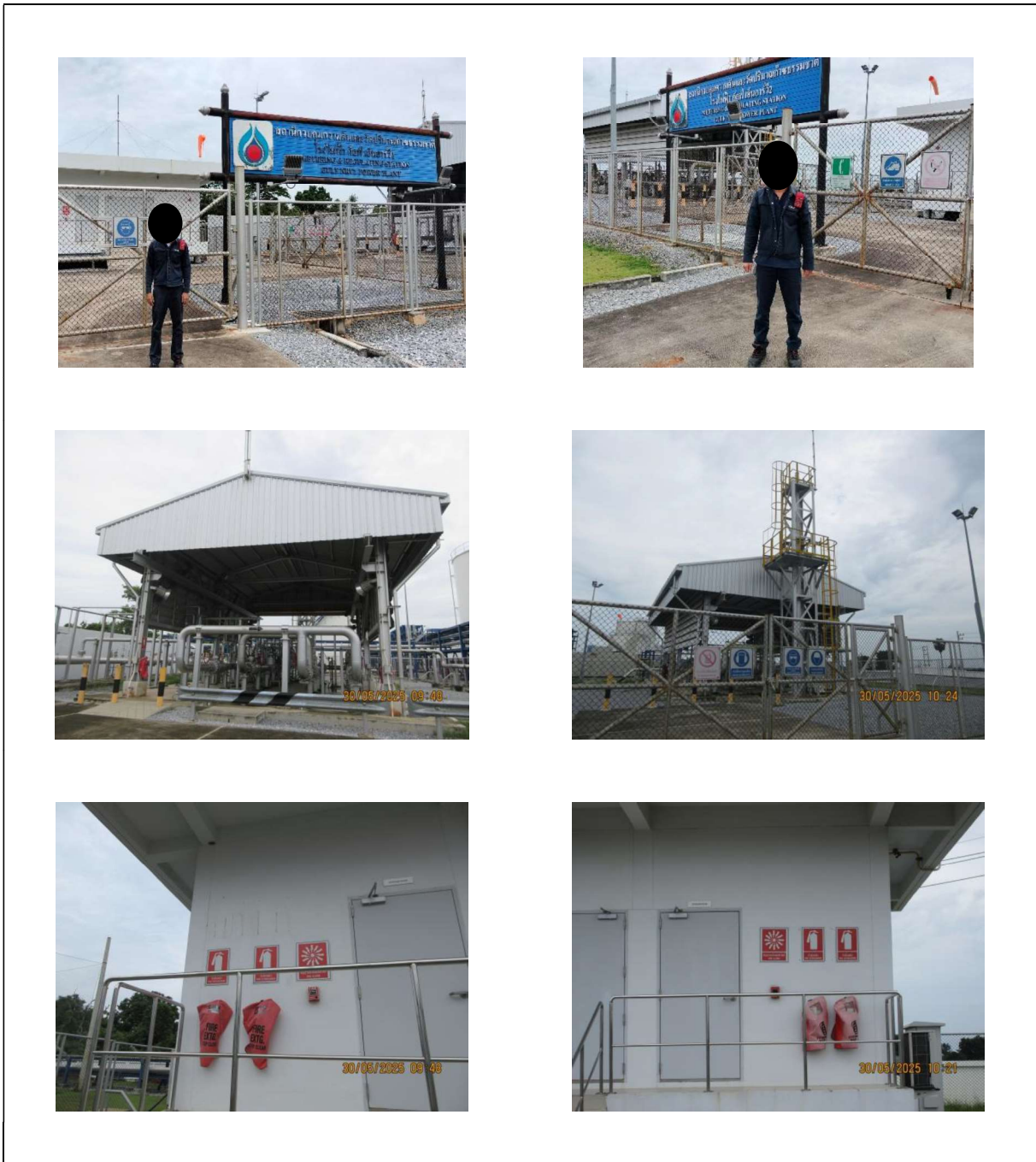
ภาพที่ 1.3-1 สภาพทั่วไปของแนวท่อส่งก๊าซธรรมชาติและสถานีควบคุมความดันและปริมาณก๊าซธรรมชาติ